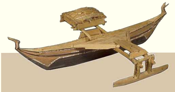
Modell eines Auslegerbootes aus Indonesien, ca. 1900, Rautenstrauch-Joest-Museum, Köln

Möbel, Gebrauchsgegenstände, volks- und völkerkundliche Objekte, Kircheninventar, Innenausstattungen, technisches Kulturgut, eben alles aus Holz: „Altes“, „Antikes“, „Alltägliches“ oder „Ausgefallenes“.