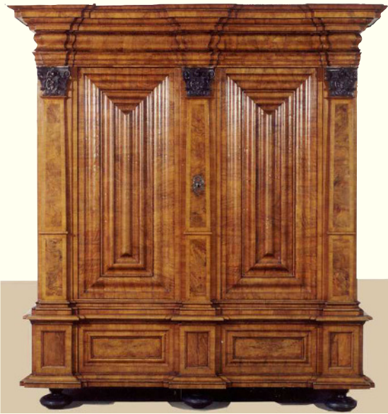
Wellenschrank, um 1750, Museum Pfalzgalerie Kaiserslautern

Möbel, Gebrauchsgegenstände, volks- und völkerkundliche Objekte, Kircheninventar, Innenausstattungen, technisches Kulturgut, eben alles aus Holz: „Altes“, „Antikes“, „Alltägliches“ oder „Ausgefallenes“.