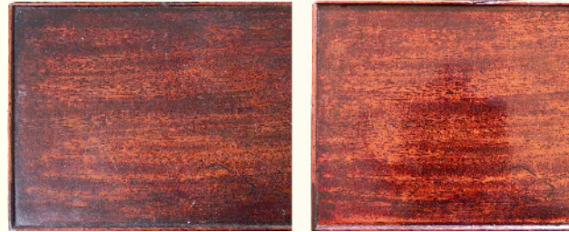
Regenerierung einer Schellackpolitur (vorher / nachher)

Wir reinigen, regenerieren, retuschieren oder erneuern historische Oberflächen, festigen lose und pudern Partien und legen verborgene Überzüge frei.