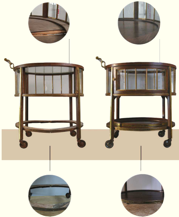
Teewagen, ca. 1920er Jahre, Privatbesitz (vorher / nachher)

Wir restaurieren Ihre Möbel und Holzobjekte nach traditionellen und modernen Techniken. Dabei fügen sich Ihre persönlichen Wünsche und unsere Qualitätsansprüche zu einem perfekten Ergebnis.